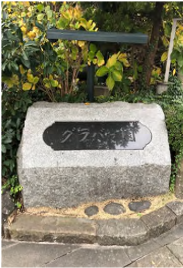
▲ 구라바엔 입구

Blake Glover, 1838-1911) 저택을 비롯해 3 개의 국가 지정 중요 문화재 주택과 나가사키 시내의 귀중한 서양식 건축물을 볼 수 있습니다. 3 개의 국가 지정 중요 문화재인 글로버 저택과 오르토 저택, 링거 저택은 150 년 이상 그대로 보존되고 있는 귀중한 유산입니다. 이 세 곳 모두 국가 지정 주요 문화재로서 「메이지 일본의 산업 혁명 유산(明治日本の産業革命遺産)」의 구성 자산에 등록되어 있습니다(구라바엔 홈페이지 2018 년 12 월 25 일).