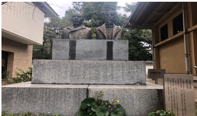
▲ 이토와 무쓰의 흉상

서양 열강들의 간섭을 심각하게 우려하고 있었습니다. 실제로 북경 진군 여부를 두고 군부를 대표하는 육군대장 야마가타 아리모토와 정치부를 대표하는 이토 히로부미는 큰 갈등을 빚습니다. 이토는 “이러한 상황이 발생한다면 일본은 청국이 아니라 서양 열강들과 강화조약을 협상하게 될 것이다”라고 말했고, 일본 정부는 이토의 안전을 받아 들이게 됩니다.