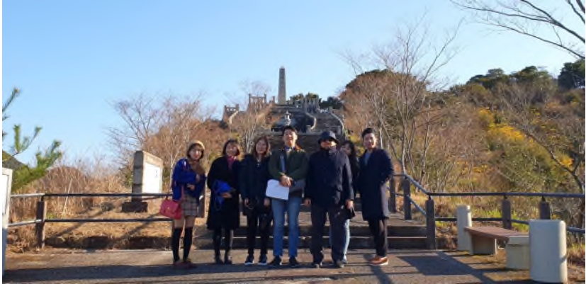
▲ 햇살이 부서져 내리던 도조이삼평비 앞에서

때문입니다. 그렇다면 일본과 조선의 도자기 산업에 있어서 결정적인 차이로 작용한 요인은 무엇일까요?