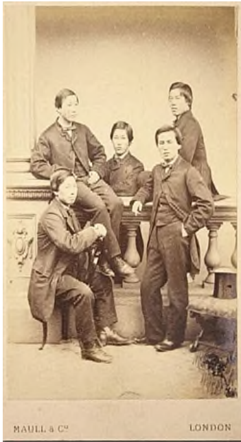
▲조슈5인. 상단좌측부터 엔도 긴스케, 이노우에 마사루, 이토히로부미. 앞줄 왼쪽부터 이노우에 가오루, 야마오 요조

그렇다면 글로버는 어떻게 일본의 젊은 청년들인 조슈 5 인을 영국으로 유학을 보냈을까요? 또한 이 5 인들은 어떤 인물들일까요?