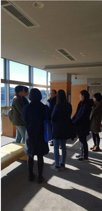
▲일본 해상자위대 사세보 사료관 견학 전, 선생님의 설명을 듣고 있다.

일정 내내 중국의 현재와 미래를 어떻게 하면 더 잘 파악할 수 있을까라는 생각에 사로잡혀 있었습니다.