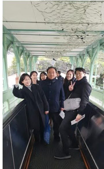
▲마치 홍콩의 미드레벨 에스칼레이터같다며 수다를 떨었다.

마지막으로, 사실상 새로운 내용이 없는데, 마치 새로운 책을 한 이유는 무엇일까요? 심지어 그 이름을 시진핑 사상이라고 잡고, 나아가 당헌에도 추가한 이유는 무엇일까요? 앞으로 더 지켜볼 부분이기는 하지만, 현재 시점에서 냉정하게 보자면 오히려 시진핑의