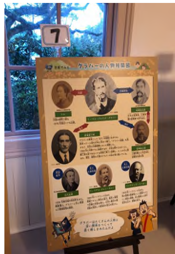
▲구라바엔에 전시되어 있던 만화 글로버의 인물관계도