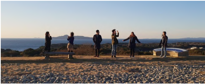
▲ 나고야 성터에서 사랑방 11기 일동

교류박물관에서 나와 저희는 나고야 성터로 향했습니다. 숲길을 지나 언덕에 다다랐을 때, 바다가 한눈에 보이는 것이 장관이었습니다. 바닷바람을 맞으며 저희는 답사 둘째 날 마지막 일정을 마쳤습니다.