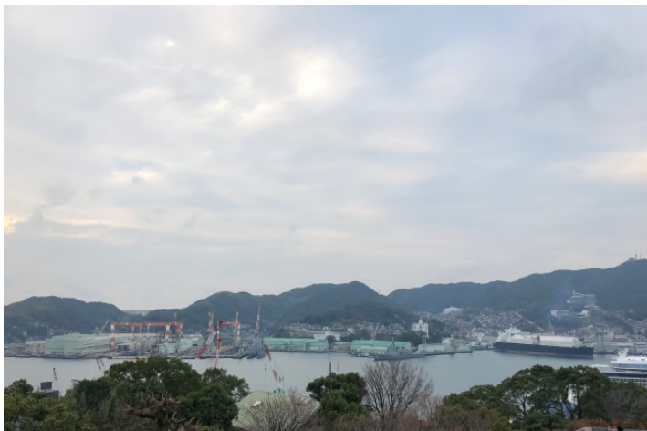
▲ 글로버 저택에서 바라본 나가사키 항

외국인이 방문하였고, 산업화를 지향하는 무사들에게도 최신기술의 정보를 얻을 수 있는 중요한 장소가 되었습니다.