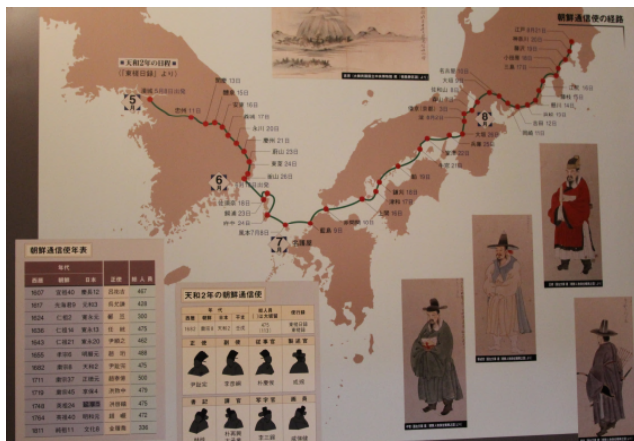
▲ 조선 통신사의 경로

사대자소를 예로 받아들이며 천하질서 아래 한학 역관으로 지냈던 김지남이 본 일본은 어땠을까요? 김지남의 일본 방문기 <동사일록>을 통해 일본에 대한 김지남의 이중적인 시각을 알아보겠습니다.