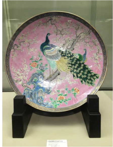
▲ 규슈 도자기문화관에 전시된 화려한 도자기 그릇

도자시장에서 가장 기본적인 수요였던 청화백자뿐만 아니라 채색자기까지 다양한 용도와 기형의 도자들이 상당수 수출되었습니다. 유럽인의 수요에 맞춘 일본 상품들의 차별성은 19 세기 유럽 내 '자포니즘'이라는 일본풍의 유행을 이끌게 됩니다. 이처럼 일본이 VOC의 요청에 부합하는 청화백자를 생산할 수 있는 기술을 얻게 된 데는 일본으로 (강제)이주한 조선 도공들의 역할이