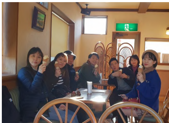
▲ 한일교류박물관 앞 카페에서 사랑방11기

조선시대 때 통신사를 통해 문화, 의료, 기술 등을 교류한 것과 일맥상통한 것 같습니다. 한 시간 반을 달려 도착한 한일교류박물관 에는 파랗고 높은 하늘과 맑은 공기가 저희를 반기고 있었습니다. 한일교류박물관에 입장하기 전에 저희는 박물관 앞의 카페에서 아이스크림을 먹으며 수도도 떨어졌습니다. 한 학기 동안 열심히 토론하고 공부하느라 나누지 못했던 얘기들을 하며 뽀뽀했던 규슈 일정에 잠시 쉬어갈 수 있는 시간이었습니다.