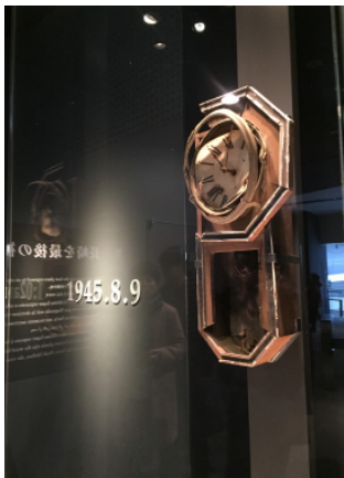
▲ 원폭자료관에 전시된 시계. 원폭이 투하된 시간에 멈춰있다.

명이 즉사하였습니다. 동시에 원자폭탄은 미국과 일본 간의 새로운 질서를 형성하였고, 세계대전을 종료시키고 이후 냉전시대를 본격적으로 진행시키는 촉매제가 되었습니다. 뿐만 아니라 한국도 일본의 피폭으로 큰 변화를 겪습니다. 당시 일본제국의 식민지였던 한국은 일본의 무조건 항복으로 인해 비자발적 광복을 맞게 되고 한반도는 냉전의 격전지가 되고 맙니다.