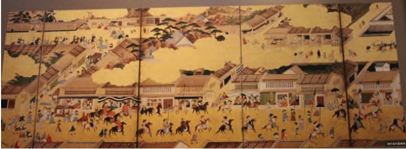
▲ 일본을 방문한 통신사 사절단

역할을 하게 되었습니다. 그때 김지남은 떠날 때부터 돌아올 때까지의 96일간 보고 느낀 것들을 자세히 기록한 <동사일록>을 작성하게 됩니다. 자신이 나눈 대화, 관찰한 역참들, 일본의 풍경 및 시설에 대해 자세히 기술하고 있어 중요한 사료로 남아있습니다.