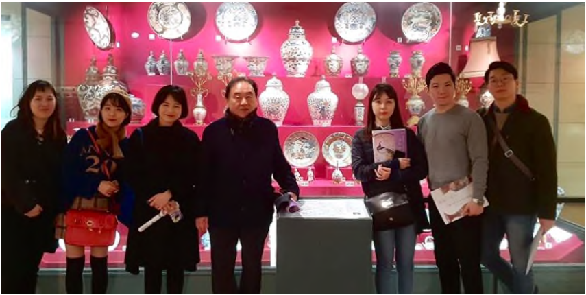
▲ 청화백자를 넘어선 일본만의 도자기 양식을 창조하다

의해서만 설명되는 것이 아니라 작금의 국제정치적 환경, 국제경제적 환경에 따라 변화할 수 있는 가능성이 크다는 것을 알려줍니다. 따라서 이러한 기술 전파와 당대의 정치, 경제 환경이 미래의 국제정치 구조에 어떻게 서로 영향을 미칠 것인지를 충분히 인식하고, 과거로부터의 교훈을 바탕으로 우리는 21 세기의 복합적 외교전략을 수립해야 할 것입니다.