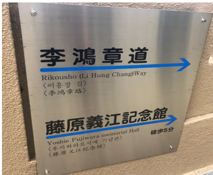
▲ 이홍장이 피격되었던 길 안내표시

일본이 내세운 과도한 조건을 조금은 완화할 수 있을 거라 기대했습니다. 피격 직후 “내 비록 목숨을 버릴지라도 국사에 도움이 된다면 이 목숨 아끼지 않을 것이다”라고 말했다고 합니다. 또한 일본인 의사가 수술을 권유하자 “지금 나라에 중요한 일이 많아 한 시라도 강화를 지체할 수 없다. 내 어찌 사사로운 일로 지체하여 국사를 그르칠 수 있겠느냐”라고 반문했다고 합니다. 이홍장의 예측과 같이, 해당 사건을 계기로 일본은 배상금을 2 억 냥으로 감축하고 미루어 왔던 휴전협정을 체결하게 됩니다.