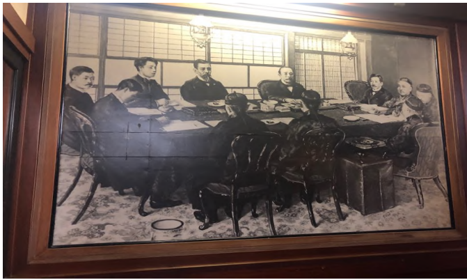
▲ 협상 당시를 복원한 그림

총리의 채택되었지요. 이와 같은 두 사례에서 나타나듯이 일본은 청나라에 대해 강경한 강화 조건을 제시하고자 하는 욕망과 국제정치적 계산에 의해서 서양 열강의 개입을 방지하고자 하는 이중적 인식을 보입니다.