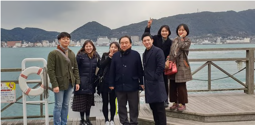
▲ 답사 마지막 날, 가라토 시장 옆 에서 사랑방 11기

같고, 이 때문에 중국을 계속 관찰할 저도 엄두가 안 나기도 합니다. 그때마다 사랑방에서 배운 동주의 질문 ‘우리 겨레는 왜 이토록 취약한가?’와 답사 내내 작고 연약했던, 국제정세의 세력경쟁을 오판했던 ‘조선’이 떠오를 것 같습니다. 사랑방에서 내내 배웠고, 이번 중국의 외사회에서도 언급했듯, 현재의 우리가 서있는 위치를 파악하고, 그 위치에서 마주한 여러 변수들이 만들어낸 상황을 해석하고, 우리의 이익을 계산하는 자세로 국제정세와 외교를 다루어야 할 것입니다.