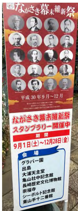
▲메이지유신 150주년 기념 ‘나가사키 막말 유신제’

그렇다면 메이지유신이 일본 사회에서 가지는 의미는 무엇일까요? 메이지유신 당시의 시대적 배경을 먼저 살펴보면, 17 세기 초부터 백여 년 넘게 쇄국 정책을 유지해온 에도 막부가 1853 년 미국 동인도함대의 페리 제독이 무력시위로 개국을 요구하자 막부의 정책은 흔들리기 시작한 데서 출발합니다. 굳건히 유지될 것이라 믿었던 막부 정권의 흔들림이 곧 일본 사회의 변화의 시작이라고 볼 수 있습니다. 막부는 이 상황에 독단적 결정을 하지 못하고 조정과 각 지방의 영주인 다이묘들에게 자문을 구했는데, 조정과 대부분의 다이묘들은 개국을 반대했었습니다. 그러나 당시 막부 최고 실권자 이이 나ოს케(井伊直弼)는 1858 년 개국 반대 세력을 탄압하고 고메이(孝明)