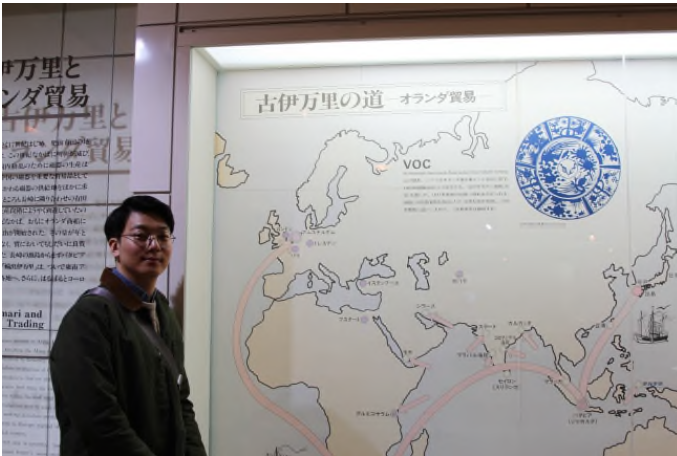
▲ VOC를 통해 유럽으로 전파된 일본 도자기

경덕진에는 수천 개의 가마가 위치하여 도공만 5 만 내지 6 만에 달했다고 합니다. 이를 미루어보아 중국의 생산 공백기에 일본의 생산량이 급증했다고 하더라도 이전에 충분한 생산기지와 기술을 확보하고 있었던 중국의 재부상은 일본의 도자기 무역을 위협했을 것으로 보입니다.