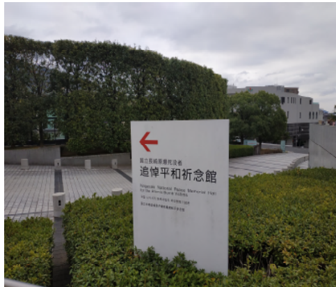
▲ 원폭 자료관으로 향하는 길

설렘과 동시에 다소 무거운 마음이 들었습니다. 특히 이 원폭 투하에서 가장 중요한 행위자인 미국을 중점적으로 분석한 지금까지의 저의 공부와, 답사를 통해 만나볼 일본이 바라보는 ‘세계 유일의 피폭국’인 그들 일본을 조선에 대한 ‘제국주의적 식민 지배’ 경험을 기억하고 있는 21 세기 사랑방의 우리들이 어떻게 받아들이고 공부해야 하는지 고민하면서, 우리는 나가사키 원폭 자료관으로 향하였습니다. 답사는 크게 원폭 자료관, 나가사키 평화공원, 그리고 원폭조선인 피해자 추모비의 방문으로 준비하였습니다.