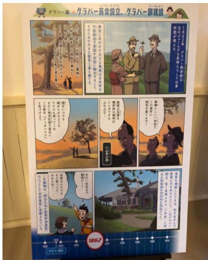
▲구라바엔에 전시되어 있던 만화 글로버 상회와 글로버저택의 설립

상회가 들어갈 수 있는 여지가 없고, 민간 사업으로서 차의 수출부터 장사에 착하였습니다. 이 당시 글로버의 입장에서는 사업을 실행하는데 있어 여러 걸림돌이 있어 많은 고난과 역경을 겪었다고 합니다. 하지만 추후에는 이러한 글로버의 정치적 결탁이 추후의 인생을 바꾸는 결정적인 계기가 됩니다. 이윽고 에도막부 말기 시사와 관련해 반막부적인 다른 번과의 무기 탄약, 함선의 판매로 변경하게 되었습니다. 무기 상인으로 활약하게 된 글로버는 적극적인 무역으로 막대한 부를 쌓으면서 프리메슨의 사상인 자유, 평등, 박애를 근왕의 지사들에게 배양해 나갑니다. 이러한 사상을 가장 깊이 결합하는 것이 사카모토 료마입니다.