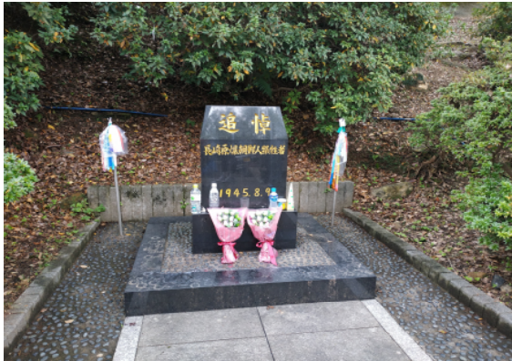
▲ 원폭조선인희생자추모비에 놓여진 물병의 모습들

원폭 자료관 본관과 나가사키 평화공원의 방문 후에 우리는 공원 안에 잘 보이지 않는 곳에 숨어있는 원폭조선인피해자추모비를 방문하였습니다. 1979 년 8 월 9 일 나가사키 재일조선인 인권을 지키는 회에서 만든 이 추모비는 공원 내에서도 후미진 곳에 숨어 있었습니다. 이정표 하나 없이 찾아간 이곳에 설치된 안내판도 많이 닳아 있고 글씨들이 지워진 상태였습니다. 미국이 나가사키에 원자폭탄을 투하함에 따라 약 만 명의 조선인이 폭사하였고 2 만 명의 조선 사람들이 피폭한 것을 추모하며, “우리들 이름 없는 일본 사람들이 얼마간의 돈을 모아 이곳 나가사키에서 비참한 생애를 보낸 1 만여명의 조선 사람을 위하여 이 추모비를 건설하였다”라고 설명이 되어있었습니다.