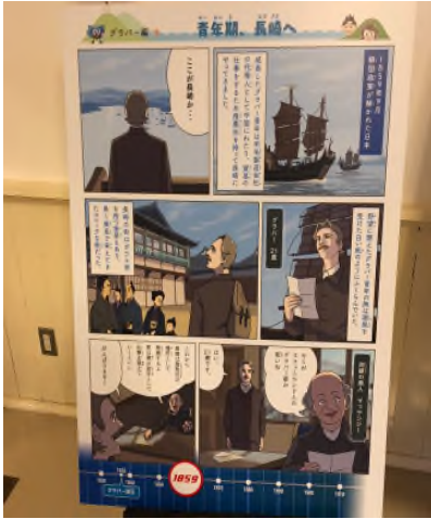
▲ 구라바엔에 전시되어 있던 만화 “1859년의 글로버”

일본이 맺었던 불평등 조약 중 하나로서, 이를 계기로 이 해 9 월 글로버는 매킨지의 부하 상인으로서 나가사키에 도착합니다.