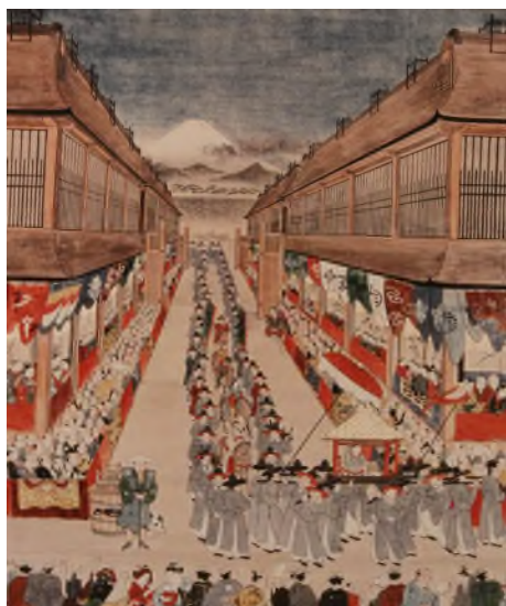
▲ 조선 통신사와 일본 국민들

일본에 대한 부정적인 시각이 드러날 때는 자신의 말을 인용한다든지 감정적인 표현을 했던 것과는 달리, 이러한 일본의 긍정적인 면에 대해서는 객관적으로 표현하는 듯한 모습에서도 김지남의 이중적인 시각을 볼 수 있습니다. 나아가 김지남은 일본인들의 질서의식에 대해 관찰하며