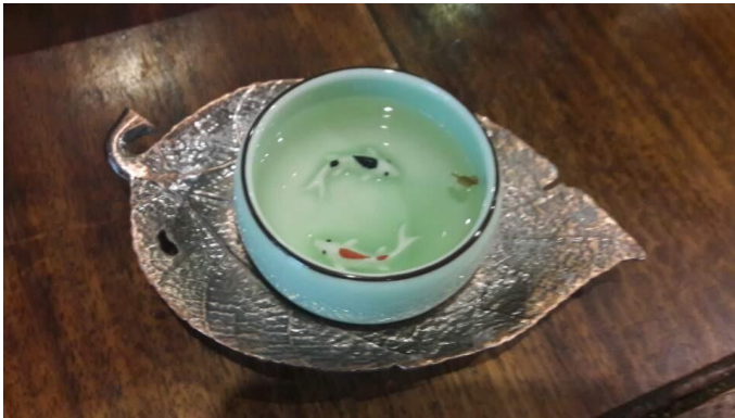
▲ 유리창 찻집의 찻잔.

송별연 장면을 즉석에서 스케치하고 참석자 이름을 기록하였습니다. 그림 속 노승과 괴석이 운치 있는 별채에서 사람들은 이별의 이야기를 나누고 있고, 탁상 가운데에서 추사는 자제군관으로서 무관 복식을 하고 앞을 바라보고 있습니다. 이 잔치에서 지어진 전별시는 책으로 엮여 추사에게 기증되었습니다(유홍준 2006, 63).