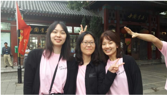
▲ 유리창 거리에서.

이덕무가, 1780년에 박지원이 방문했고, 1790년 유득공과 박제가가 다시 유리창을 찾았습니다(이홍식 2013). 유리창을 매개로 한 한중 지식인 교류의 흐름 속에서 추사와 중국 지식계의 만남도 원활하게 이루어질 수 있었습니다. 부지런히 도서와 자료를 수집하던 추사는 기회를 놓치지 않고 변화한 유리창 거리를 확보하며 청의 문물을 접하고 사람들과 교류하였을 것입니다.