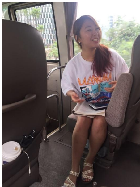
▲ 촉박한 일정으로 인해 달리는 버스 안에서 진행된 발제.

그 사회 전체의 미래를 그려보는 퍼즐로서 역할 하고 있는 것입니다. 그렇기 때문에 국제정치의 미래를 공부하는 우리에게 798 예술구는 더욱 의미 있게 다가왔습니다.