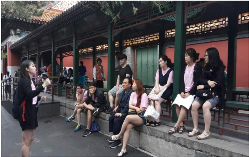
▲ 장랑(長廊)에서 진행된 발제

나뉘며 총 728m의 긴 길이를 자랑합니다. 장랑의 내부에는 중국 전통 소설, 민화, 풍경 등 다양한 내용을 담은 8천여 개 이상의 그림들로 장식이 되어 있어 그 아름다움을 더하였습니다. 저는 19세기 말 서태후가 거닐었을 장랑의 끝자락과 배운문이 만나는 지점에서 본격적인 발제를 시작하였습니다.