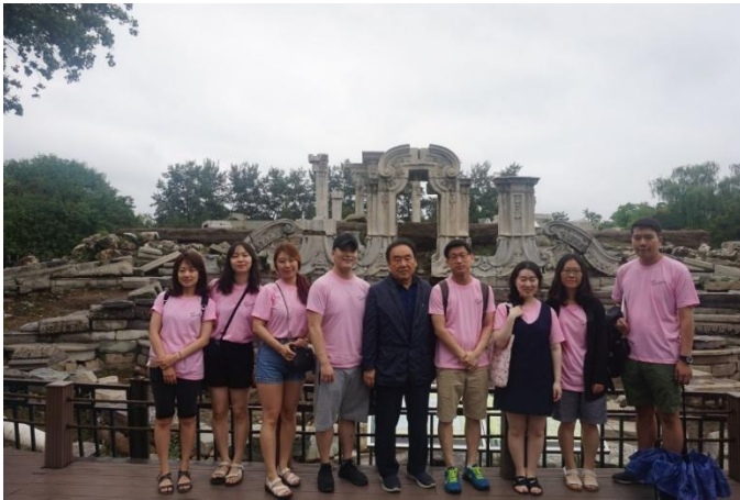
▲ 폐허로 남아있는 서양식 석조건물 앞에서.

원명원을 본격적으로 예전처럼 화려한 모습으로 복원하지 않고 있습니다. 대신 폐허로 남은 원명원을 통해 중국 인민들에게 지난 세기 치욕의 역사를 잊지 말라고 당부하고 있습니다. 우리가 답사를 했던 장소들 가운데에서도 원명원은 항일전쟁기념관과 함께 중국인 관광객이 유독 많은 곳이었습니다. 아마 그들 가운데 여럿이 무너져 내린 건물들과 황폐한 원명원의 옛터를 보면서 리다자오와 같이 울분을 삼키며 ‘위대한 중화민족의 부흥’을 꿈꾸고 있는지 모르겠습니다.