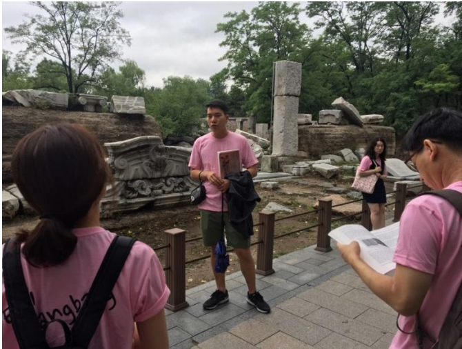
▲ 서양루 앞에서 진행된 발제.

동서양의 건축물들이 혼재되어 문명복합제국으로서 청을 상징하던 원명원은 1860년에 영국과 프랑스 군인들의 군화에 짓밟히고 불길에 휩싸였습니다. 당시 황제였던 함풍제(咸豐帝)는 원명원이 영불연합군에 의해서 소실되었다는 소식을 듣고 진노하였고, 그 상실감 때문이었는지 이윽고 사망하였습니다. 이후 대청제국은 서구열강들에게 ‘불평등 조약’을 강요당하였고 반(半)식민지 상태로 전락하게 되었습니다. 이처럼 대청제국과 원명원, 두 문명복합공간은 흥망성쇠를 함께 했습니다.