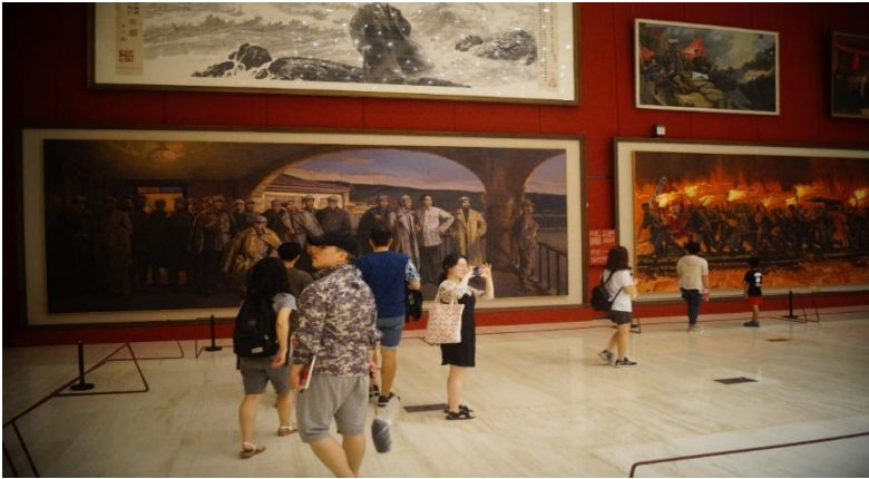
▲ 1 층 ‘지도자·인민’ 현대미술작품 전시실

면적에서 약 130 만개의 유물을 소장하고 있는데, 저희 답사팀은 이런 국가박물관에서 보낼 수 있는 시간이 약 한시간 반으로 최대한 의미 있는 시간을 보내고 나와야 하는 미션을 안고 양직공도의 백제사신을 만나러 국가박물관에 입장하였습니다.