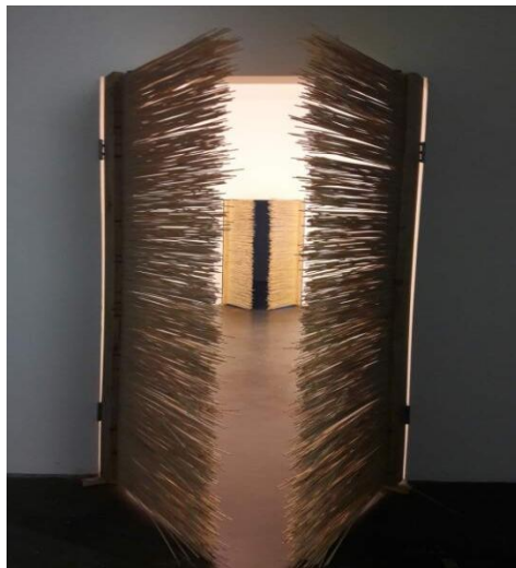
▲ 현대미술관 내 전시된 작품

방 이후, 여전히 국가의 통제와 검열이 존재하는 사회이긴 했지만 적어도 당시 모습에 문제의식을 느끼는 사람들은 보다 큰 목소리를 낼 수 있는 환경도 함께 만들어지기 시작하였습니다. 그 목소리들의 선두에는 예술이라는 문화가 자리 잡고 있었고, 최전선 지역으로 다양한 비정통 예술가들이 터전을 마련한 798예술구가 존재하였던 것입니다. 798예술구는 또한 중국 예술에서 과거와 현재, 중국과 서양이 모두 공존하는 복합성과 전위성을 가장 잘 드러내는 공간으로도 역할하고 있습니다(박정희 2012, 519).