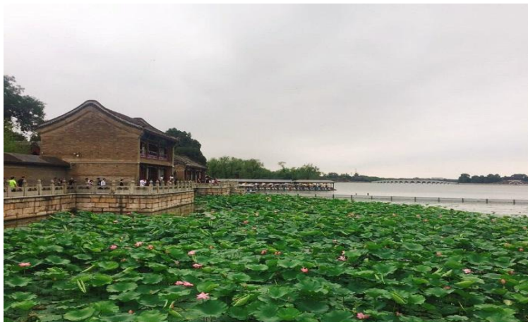
▲ 연꽃이 핀 곤명호(昆明湖)

의운관을 나와 장랑(長廊)으로 향하는 길에 연꽃으로 수놓아진 곤명호가 보였습니다. 끝을 헤아릴 수 없을 정도로 넓은 곤명호는 여름의 분위기를 머금어 더욱 아름다웠습니다. 곤명호를 따라 난 좁은 길을 따라 걷다 보니 중국 전통 화원의 모든 복도 중 가장 길다고 알려져 있는 장랑에 도달하였습니다.