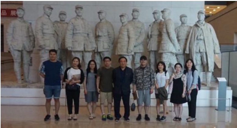
▲ 1층 로비에 있는 중국 공산당 창립 멤버 동상 앞에서

백제 사신의 이야기를 마무리하는데 버스는 딱 알맞게 국가박물관 앞에 도착하였습니다. 중국 국가박물관은 축구장 27 개에 해당하는 192,000 제곱 미터로 이루어져 있어 전세계 박물관 중 가장 큰