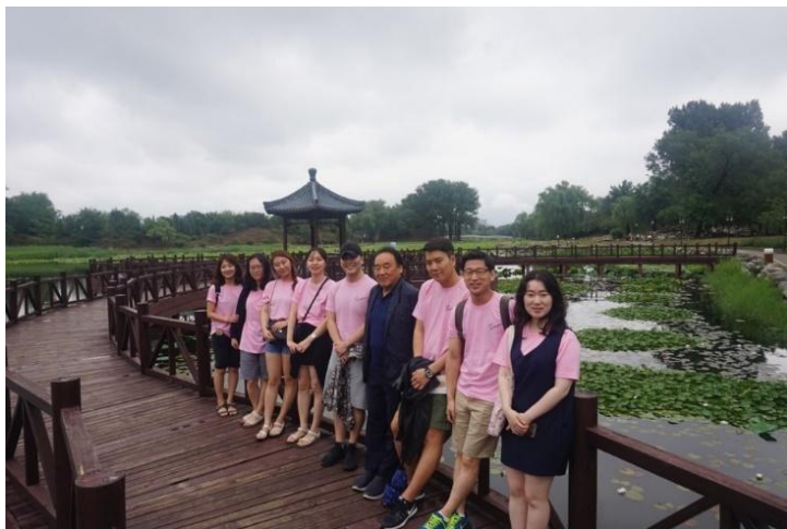
▲ 원명원 내 호수 앞에서.

비록 건륭제는 매카트니에게 서구의 문물이 조금도 필요하지 않다고 이야기를 했지만 원명원 안에 대규모의 서양식 건축물들을 세운 황제는 바로 건륭제였습니다. 유럽식 궁전과 정원을 원명원에 지음으로써 건륭제는 청이 이끄는 중화문명이 서양세력까지 천하질서에 편입시켰음을 자랑하고 싶었는지 모르겠습니다. 그러나 청의 전성기는 오래가지 못했습니다. 건륭제가 사망한 1799년 이후 청은 급격히 쇠락하기 시작했습니다. 세계에서 제일 부강하던 청은 불과 60여년만에 수도 북경이 함락당하고 황제가 피난을 떠나는 상황에까지 내몰렸습니다.