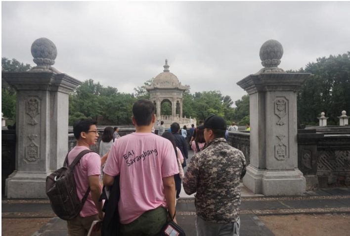
▲ 원명원 내 서양식 미로 정원에 들어서고 있다.

네르친스크조약은 러시아어와 중국어뿐만 아니라 만주어와 라틴어로도 작성되었습니다(크로슬리 2013, 186).