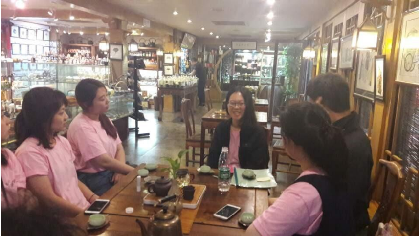
▲ 유리창의 한 찻집에서 진행된 발제.

익히게 하는 제도로 비교적 자유롭게 그곳 문물을 접할 수 있는 위치였습니다(유홍준 2006, 37-38).