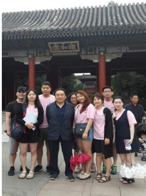
▲ 이화원 앞에서의 단체사진.

성공은 서태후의 권력과 영향력을 재차 확인할 수 있는 기회이자, 서태후를 정치영역에서 완전히 밀어내려는 변법파의 시도가 물거품이 된다는 것을 의미하였습니다. 나름대로 중국의 근대화를 위해 노력했던 광서제의 개혁은 안타깝게도 바람 앞의 촛불처럼 꺼지게 됩니다. 새롭게 정권을 쥔 서태후는 사망할 때까지 무소불위의 권력을 휘두르며 근대의 문턱에서 청의 앞날을 결정짓는 역할을 맡게 되었습니다.