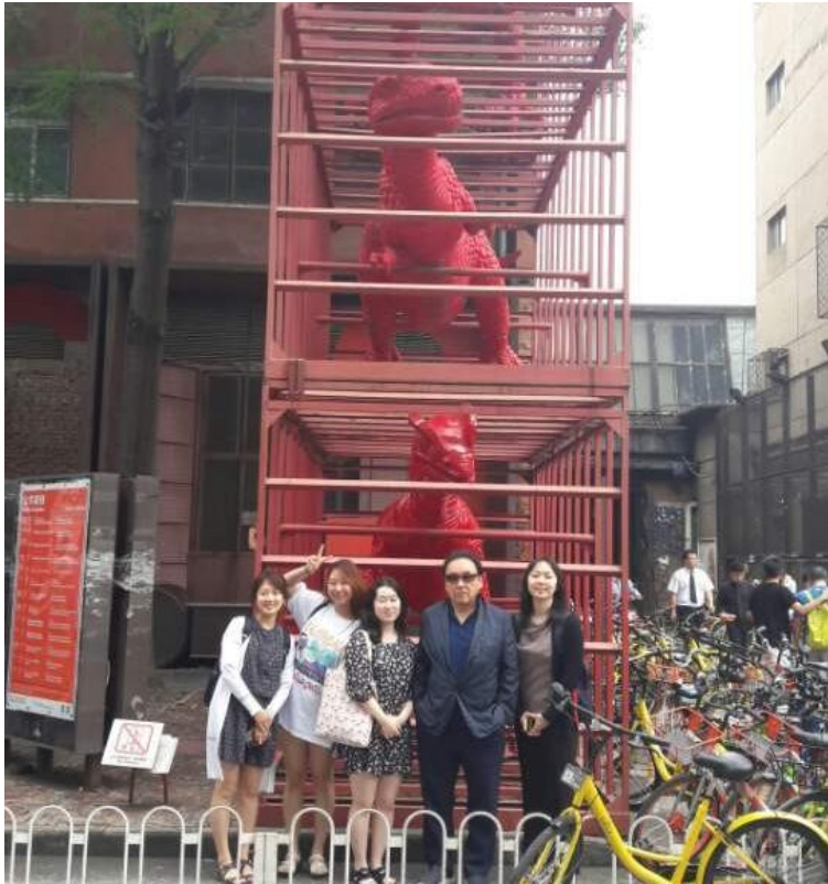
▲ UCCA 앞 공룡조형물 앞에서.

의 당대미술이 가지고 있는 정체성을 고민해보고, 나아가 중국 전체의 방향성을 예측해보는 시간을 가질 수 있을 것입니다.