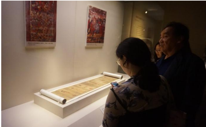
▲ 양쪽이 말린 상태로 남북조관에 전시되어 있는 양직공도

양직공도는 아래 사진에 나타나듯 두루마리 형태를 하고 있는데, 현재 양직공도엔 양나라에 조공을 바치러 온 사신 12 명이 남아 있음에도 불구하고 저희가 본 양직공도는 양쪽이 돌돌 말려 있어서 가운데 7 명의 사신만 볼 수 있었습니다. 아쉽게도 오른쪽 끝부분에 있어야 할 백제 사신의 모습은 볼 수 없었습니다