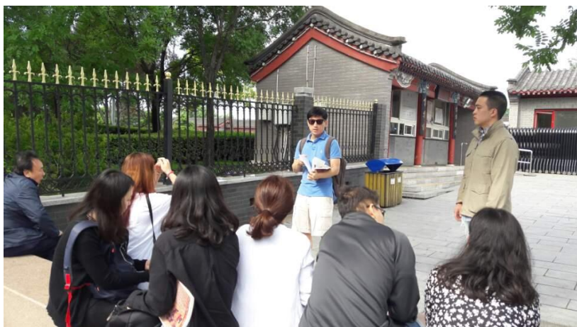
▲ 노구교(蘆溝橋)입구 앞에서 진행된 발제

이르게 됩니다. 결국 1941년 일본이 진주만 기습을 감행한 이후, 일본군과 미군의 태평양 전역의 비중이 증가하게 되면서 전세는 역전되기 시작했습니다.