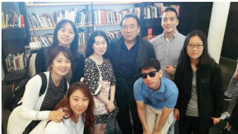
▲ UCCA 입장을 기다리며

립적인 표현 방식의 하나로 표현해나가는 모습이 나타나고 있다고 할 수 있습니다(Nuridsany 2004, 241).