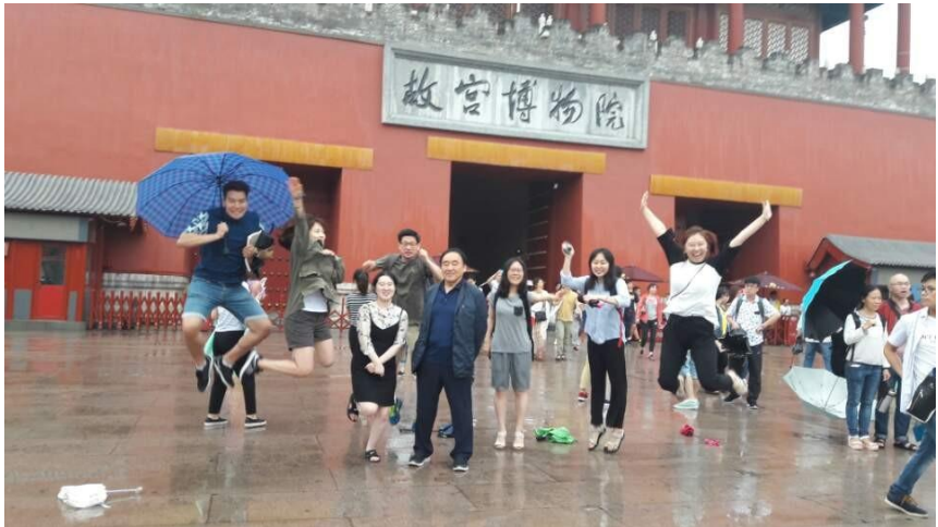
▲ 자금성을 나서며 사랑방 7기 학생들이 힘차게 뛰어오고 있다.

임(Lin)이 능(Ling)과 발음이 같으니 이름은 피하되 실질을 갖자는 계산에서 비롯된 것입니다. 비록 ‘황제총통’이었지만 중화제국 처음이자 마지막 황제로서의 예우를 받으며 자금성 무대에서 퇴장한 것처럼 보입니다. 하지만 이것은 여전히 막강한 힘을 가진 그의 측근세력이 주도한 일이었을 뿐, 그는 전국적으로 ‘나라 흠친 도둑’이라 비난 받았습니다(윤혜영 2016, 121).