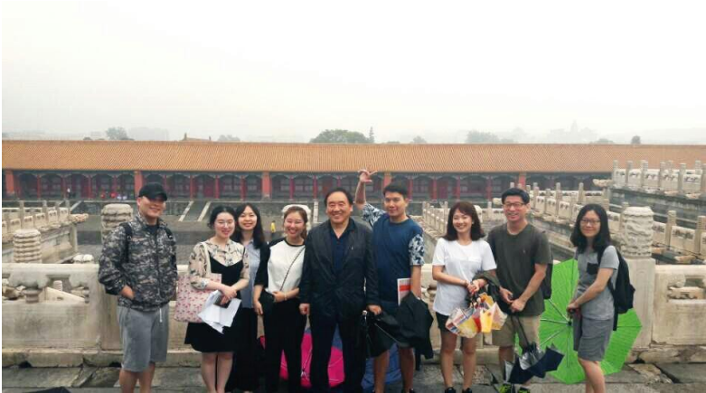
▲ 위안스카이의 총통취임식이 진행된 태화전. 태화전은 본래 명·청의 황제 즉위식 및 황실의 중요행사가 거행되던 곳이다.

갖은 책략을 통해 정식총통으로 선출되었습니다. 총통취임식과 무창봉기 기념행사는 함께 진행되었는데 그가 선택한 행사장소는 국회도 아니고 총통부도 아닌 청의 옛 황궁 자금성이었습니다. 1913년 10월 10일 태화전 앞에서 위안스카이는 육해군 대원수의 예복을 입고 국회의원들 앞에서 선서를 합니다.