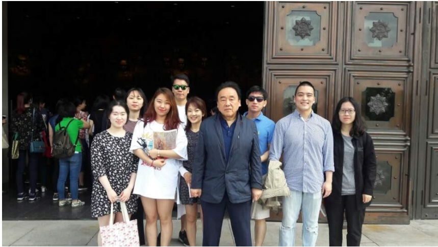
▲ 항일전쟁기념관 앞에서의 단체사진.

여산회의를 계기로 평터화이는 군사위원회 부주석 겸 국방부장직에서 물러나게 됩니다.