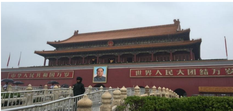
▲ ‘천상의 평화의 문’이라는 뜻을 가진 천안문(天安門)

태화전광장이 우리를 반겨주었습니다. 맞은편에는 위엄 있는 황제의 공식 직무공간이자 관료접견 공간인 태화전이 청조의 잊혀진 위상과 위엄을 뽐내며 굳건히 자리를 지키고 있었습니다. 자금성 내에서뿐만 아니라 현존하는 중국 최대의 목조건물로서 보는 이에게 위압감마저 주는 모습이었습니다. 북경의 기록적인 폭우 덕분에 자금성의 금지된 구역으로서의 면모도 더욱 빛을 발했습니다. 하지만 이곳에서 퇴장한 두 마지막 황제의 심경을 짐작해보니 쓸쓸하고 스산한 느낌도 들었습니다. 잠시 비를 피할 곳을 찾아 태화문 기와 아래에서 위안스카이의 흔적을 찾아보는 것을 시작으로 본격적인 복원작업이 시작되었습니다.